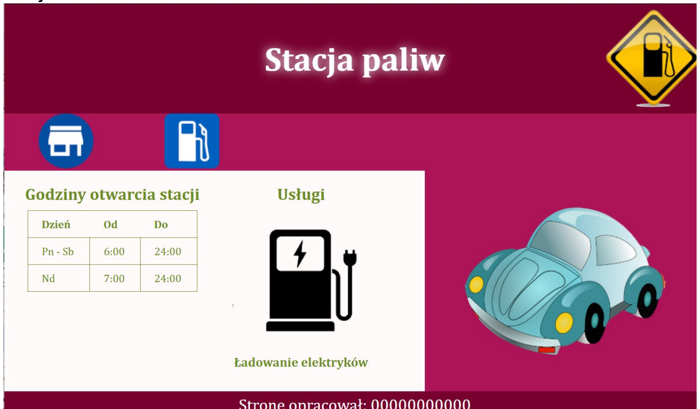
Obraz 1. Witryna internetowa, podstrona stacja.html